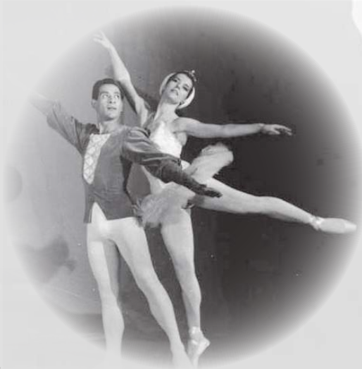
Manuel Ocampo en escena.

Entre 1965 y 1985 fue el bailarín estrella del Ballet Nacional de Guatemala. Como parte del Ballet Guatemala, realizó giras como bailarín estrella por los países de Centroamérica y Sudamérica, Alemania, España, Estados Unidos, Francia y México. Entre 1995 y 2005 ejerció además, como maestro y coreógrafo invitado del Ballet Guatemala, realizando el montaje de los ballets Don Quijote, Romeo y Julieta y La bayadera, entre otros. Falleció el 16 de diciembre de 2009.